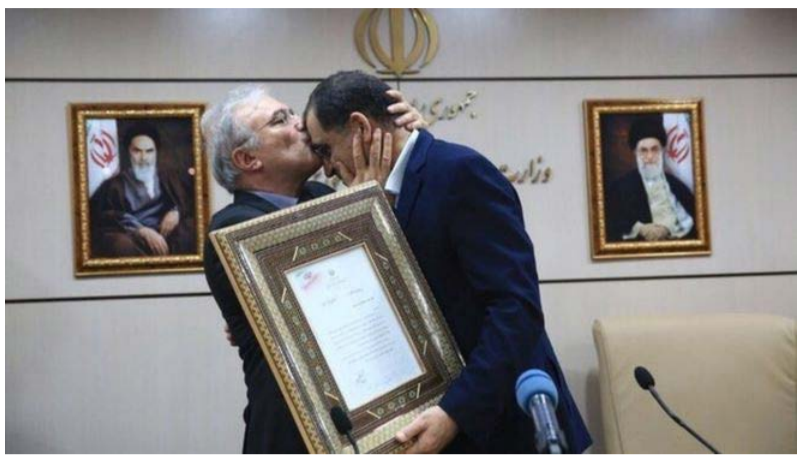
سخنگوی قوه قضائیه جمهوری اسلامی ایران گفته بعد از تکمیل تحقیقات در دادسرا و ارسال پرونده به دادگاه اگر در زمره اخلاص در نظام اقتصادی قرارگرفت این دادگاه با حضور اصحاب

است. این مقام ارشد دولتی در امور بهداشتی گفته بود در سیگار تحریم نیستیم و برترین برندهای سیگار می‌توانند حتی جلوی وزارت بهداشت شعبه بزنند و مافیای قدرتمند در واردات توتون و کاغذ سیگار دست دارند. یک سال پیش از این دونالد ترامپ رئیس جمهور آمریکا از توافق هسته ای با ایران خارج شد و تمامی تحریم‌هایی را که با این توافق متوقف شده بود را همراه با تحریم های تازه تری دوباره برقرار کرد. آمریکا می‌گوید در پی به صفر رساندن درآمدهای نفتی ایران است و هدف از این کار را عادی شدن رفتار جمهوری اسلامی ایران عنوان کرده است. دولت ایران از سال گذشته با هدف تامین کالاهای اساسی با نرخ متعادل، ارز ۴ هزار و ۲۰۰ تومانی اختصاص داده است. چند ماه پس از شروع این طرح، اعلام شد که برخی از واردکنندگان که برای واردات دارو از دولتی گرفته بودند، با ۴ هزار و ۲۰۰ تومانی جابجایی و بخرشور وارد کردند.