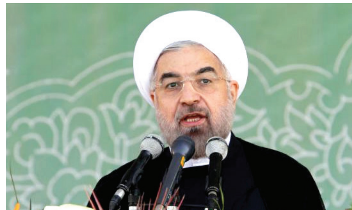
حسن روحانی، رئیس‌جمهوری ایران گفت که تحریم‌های بین‌المللی علیه ایران در حال فرو ریختن است و دلالتان تحریم باید به فکر شغل دیگری باشند. رئیس‌جمهوری ایران روز سه شنبه ۸ اردیبهشت (۲۸ آوریل) در یک مراسم کارگری در سالن ۱۲ هزار نفری استادیوم آزادی

تهران گفت که پرونده هسته‌ای ایران و حل آن، اولین گام برای حل مضامات اساسی کشور خواهد بود. به گفته او، ایران در مذاکرات هسته‌ای خود با کشورهای پنج بعلاوه یک به دنبال آن است تا ثابت کند دنبال فناوری صلح‌آمیز هسته‌ای است. آقای روحانی افزود که کشورش می‌خواهد در این مذاکرات، مشکلات و معضلاتی را که به گفته او بدخواهان به وجود آوردند، رفع کند. محور اصلی مذاکرات ایران و کشورهای پنج بعلاوه یک، اطمینان‌بخشی در مورد صلح‌آمیز بودن فعالیت‌های هسته‌ای ایران در برابر لغو نهایی تحریم‌های بین‌المللی و یکجانبه‌ای بوده که علیه ایران وضع و اجرا شده است. رئیس‌جمهوری ایران تأکید کرد در صورتی که طرف مقابل، اراده جدی داشته باشد، رسیدن به یک توافق در ماه‌های آینده امکان‌پذیر است. آقای روحانی در سخنان خود در عین حال هشدار داد که کسی در دنیا نمی‌تواند در ماه‌ها و سال‌های آینده به ایران فشار وارد کند. ایران و کشورهای پنج بعلاوه یک روز جمعه ۱۳ فروردین امسال پس از ۹ روز مذاکره، بیانیه لوزان را صادر کردند. این بیانیه شامل تقاضای هسته‌ای گم‌گامان اولین اولویت کشورهای عضو جنبش عدم تعهد باقی خواهد ماند. آقای ظریف استاد به تأخیر در استفاده از سلاح هسته‌ای در دولت ایران این تقاضا را یک پیروزی بزرگ در عرصه بین‌المللی خواند اما منتقدان، آن را