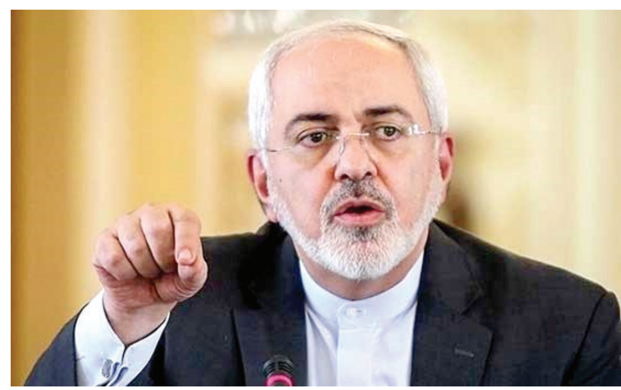
محمدجواد ظریف، وزیر امور خارجه ایران گفته است که کشورش دولت آمریکا را مسئول حفظ اموال خود می داند و اگر به دارایی های ایران دست اندازی شود، ادعای خسارت خواهد کرد. آقای ظریف روز ۶ اردیبهشت (۲۵ آوریل) در یک کنفرانس خبری مشترک با وزیر امور خارجه

مقدونیه در تهران گفت که ما از ابتدا اعلام کردیم که رای محاکم آمریکایی را به رسمیت نمی شناخته ایم و تصمیم دست اندازی به اموال ایران را غیرقانونی می دانیم چرا که خلاف مقررات حقوق بین الملل است. دیوان عالی آمریکا هفته گذشته تأیید کرد که دادگاههای این کشور می توانند در رسیدگی به دادخواهی قربانیان جرایم تروریستی، از دارایی های بلوکه شده ایران برای پرداخت غرامت استفاده کنند. آقای ظریف گفته در دیدار اخیرش با جان کری وزیر امور خارجه آمریکا، نگرانی ایران را مجدداً به او منتقل کرده است. وزیر امور خارجه ایران گفته تمام تلاش ما این است که مانع دسترسی آمریکا به اموال ایران شویم و روشن آن این است که اجازه ندهیم اموالمان وارد آمریکا شود و به این موضوع توجه داشته باشیم. آقای ظریف خبر داده که دولت حسن روحانی تصمیم گرفته کمیته ویژه ای تشکیل دهد تا اول بررسی شود چرا این اتفاق افتاده و برخلاف همه تذکرها که داده شده بود، پول ایران در آمریکا یا در مواردی که آن کشور به آن دسترسی دارد، سرمایه گذاری شده بود، دوم این که چگونه می توان مانع تکرار چنین مواردی شد و سوم اینکه چگونه می توان مانع اجرای این حکم و دسترسی آمریکا به اموال ایران شد. رای دیوان عالی آمریکا در پاسخ به تقاضای فرجام بانک مرکزی ایران صادر شده است. این بانک به رای دادگاه دیگری اعتراض کرده بود که بیشتر حکم به استفاده از حدود ۲ میلیارد دلار از دارایی های بلوکه شده ایران برای پرداخت