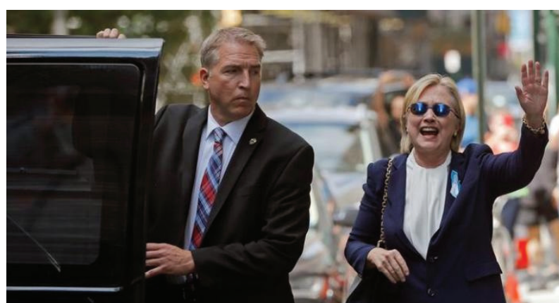
تلیفات انتخاباتی داشته و مبارزه انتخاباتی عادلانه باشد، می‌تواند تاریخ انتخابات را به تنوع ببیند.

در دو ماه آینده نه فقط تکلیف رئیس‌جمهور آینده آمریکا، بلکه تکلیف آینده سیاسی خانم کلinton هم روشن خواهد شد.