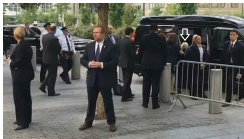
تلیفات انتخاباتی داشته و مبارزه انتخاباتی عادلانه باشد، می‌تواند تاریخ انتخابات را به تنوع ببیند.

اوایل هفته پیش که سرفه‌های خانم کلinton در کیلوند نظرها را جلب کرد، سناد انتخاباتی او موضوع را به انرژی و مصرف آنتی‌بیوتیک که باعث خشکی گلو می‌شود مربوط دانست و اینکه خانم کلinton مجبور بوده زیاد صحبت کرده اما بعد در مقابل دوربین‌های تلویزیونی و در