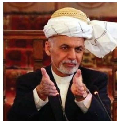
اشرف غنی رئیس جمهوری افغانستان گفته که موافقت‌نامه آشتی با حزب اسلامی به رهبری گلبدین حکمتیار به زودترین فرصت ممکن

مقام‌های محلی در ولایت قندهار، در جنوب افغانستان می‌گویند که دو مهاجم وارد شفاخانه/ بیمارستان خوزه‌ای میرویس در این ولایت شده‌اند. صمیم اخیلوک، سخنگوی والی قندهار گفته است که حوالی ساعت ۱۱ به وقت محلی، روز دوشنبه ۲۲ سنبله/شهریور دو مهاجم