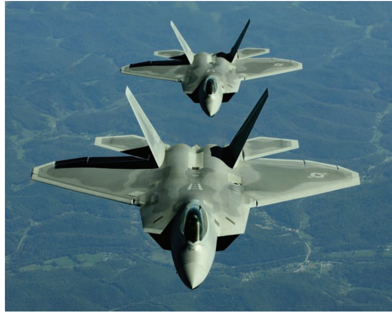
آنها اخطار داده‌اند که مسیر خود را تغییر دهند و وارد حریم هوایی ایران نشوند وگرنه با خطر شبکه فاکس‌نیوز به نقل از مقامات ارتش آمریکا،

پس از اخطار ایران، تصمیم گرفته شد که این دو جنگنده بدون توجه به اخطار ایران به مسیر خود در خط هوایی بین‌المللی ولی نزدیک به حریم هوایی ایران ادامه دهند. یک مقام ارتش آمریکا در پاسخ به این پرسش که چرا این دو جت نزدیک ایران در حال پرواز بوده‌اند به فاکس‌نیوز گفت: «ما می‌خواستیم واکنش ایرانیان را بسنجیم.» او ادامه داد: «شما می‌توانید به کسی بگویید از مزرعه من برو بیرون اما ما اصلا در مزرعه آنها نبودیم.» این مقام نظامی همچنین تهدید به سقوط را که از سوی ایران عنوان شده غیرحرفه‌ای دانسته است. یک نظامی دیگر آمریکایی نیز گفته است: «ما هیچ تهدیدی در آن در حال پرواز نداشتیم. ما می‌خواستیم ببینیم پرواز کرده‌اند یا نه.» نظامی ایران در آنجا وجود نداشته است. هفته گذشته نیز وزارت دفاع آمریکا به خبرگزاری رویترز اطلاع داد که شناورهای نظامی ایران و شناورهای آمریکا در آب‌های جنوبی ایران رو در رو شده‌اند. مقامات ارتش آمریکا در حال بررسی این موضوع هستند که آیا واقعا برخورد میان نیروهای ایران و آمریکا در خلیج فارس بیشتر شده یا اینکه گزارش‌هایی که فرماندهان آمریکایی می‌دهند بیشتر به دلیل حساسیت‌های افزون شده نیروهای ایرانی است.