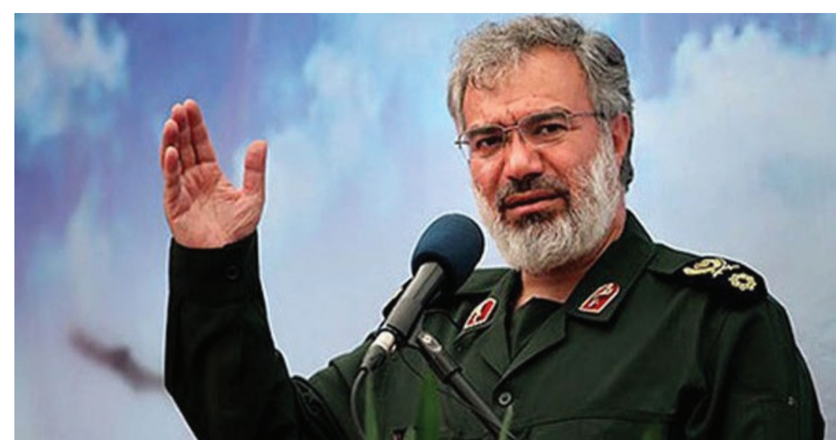
علی فدوی، فرمانده نیروی دریایی سپاه پاسداران گفته است که از سال گذشته خورشیدی آمریکاییها مجبور هستند در خلیج فارس به گفته‌های آقای فدوی را منتشر کرده اند که با

بن روز، از مشاوران بلندپایه دولت اواما پس از مصاحبه ای با نیویورک تایمز در مورد نحوه دفاع از توافق اتمی با ایران که باعث جنجال شده، می‌گوید تنها هدف او انتشار حقایق در مورد توافق اتمی بوده است. بن روز، از دستیاران با نفوذ تیم مشاوران امنیت ملی آمریکا، در وبلاگ خود در سایت میدیوم به واکنش‌ها به مصاحبه اش با نیویورک تایمز که روز پنجشنبه منتشر شده بود پاسخ داد. آقای روز، در آن مصاحبه به دیوید ساموئلز، خبرنگار نیویورک تایمز، گفته بود خبرنگارانی که توافق هسته ای با ایران (برجام) را پوشش دادند نسبت به امور جهان کم‌اطلاع هستند و تویجا گفت که موفق به جا انداختن روایت خود از توافق از طریق آنها شده است. از نظر منتقدان برجام آن مصاحبه این سوال را پدید آورده که آیا دولت باراک اواما برای به کرسی نشاندن آن توافق افکار عمومی را همراه کرده است. از جمله سناتور جمهوری خواه، جان مک‌کین، گفته که کاخ سفید واقعیت‌ها را دستکاری کرد و در برخی موارد اطلاعات ساختگی منتشر کرد. اما بن روز در یادداشتی که یکشنبه شب منتشر شد گفت که آن کمپین روابط عمومی فقط با هدف آشکار کردن حقایق به راه افتاده بود. جاش ارنست، سخنگوی کاخ سفید روز دوشنبه در کنفرانس خبری روزانه خود با سوال خبرنگار فاکس نیوز مواجه شد که پرسید: آیا شما قاطعانه تکذیب می‌کنید که مقام‌های بلندپایه دولت علنا درباره جنبه‌های توافق اتمی دروغ گفته اند؟ آقای ارنست پاسخ داد بله و افزود فکر می‌کنم واقعیت‌های این توافق و فواید آن روشن می‌کند که امنیت ملی ایالات متحده آمریکا بهبود