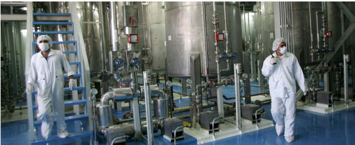
این است که ایالات متحده را به بازگشت بی قید و شرط به برجام و حذف همه تحریم های مربوطه سوق دهند. یک سخنگوی ارشد دولت ژاپن نیز اعلام کرد این کشور عمیقاً نسبت به غنی سازی ۲۰ درصدی اورانیوم توسط ایران ابراز نگرانی کرده و افزود: «اقدام فوری برای تمامی طرف ها هسته ای باید پدید آمده و از اقداماتی که می توانند منجر به تشدید تنش ها شوند، پرهیز کنند. این مقام چینی در نشست خبری خود در پکن بر تلاش های دیپلماتیک برای حل این مسئله تأکید کرده و افزود: «اقدام فوری برای تمامی طرف ها

چین و ژاپن اقدام جمهوری اسلامی ایران در غنی سازی اورانیوم با خلوص ۲۰ درصد را نگران کننده خوانده اند. چین خواستار خویشتن داری طرفین شده است. آمریکا این اقدام را «خادای هسته ای» از سوی تهران خوانده است. وزارت امور خارجه آمریکا غنی سازی ۲۰ درصدی اورانیوم توسط ایران را محکوم کرده و آن را «خادای هسته ای» خواند. به گزارش خبرگزاری فرانسه و به نقل از یک سخنگوی این وزارتخانه که نامش فاش نشده این اقدام جمهوری اسلامی «علاشی آشکار برای پیشبرد کارزار اخادای هسته ای» بوده و این تلاش «به جایی نخواهد رسید.» روز سه شنبه ۱۶ دی (پنجم ژانویه) یک سخنگوی وزارت خارجه چین نیز گفت مسئله هسته ای ایران «در مقطعی حساس» قرار گرفته و «به شدت پیچیده است.» به گزارش روتیزر هوا چونینگ، سخنگوی وزارت خارجه چین اظهار داشت این کشور از تمامی طرفین درخواست حفظ آرامش و خویشتنداری دارد و از آنها می خواهد تا به توافق